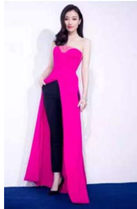
图4 高开衩礼服裙内搭配裤装的新组合形式