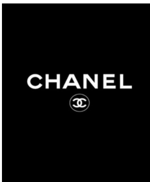
图5 Chanel 品牌中善用 的低长调明度关系

香奈儿喜欢运用无彩色系,她说:“黑色与白色包含、代表了所有的一切,它们的美是绝对的。”这与以前西方女性服装中追求女性柔美气质的服装配色方法是截然不同的,香奈儿爱用黑色来打造出端庄、高贵的不朽时尚感。但她嫌黑色太单调,于是便从孤儿院抚养她长大的修女、以及女佣的制服取得灵感,在衣领、袖口褶边加入白色,打破乏味与肃穆。并巧妙的运用了色彩对比与调和原理中的重复和呼应的手法,让配色更加的和谐。在沿用至今的香奈儿品牌标识中的配色也是与其风格完全统一,黑色底上面一个简单的品牌双c标志图案,或者纯白色的底色上一个简约的黑色品牌双c标志图案。这种低长调、或高长调的配色设计给人以前卫、强烈、明快、坚定、威严、庄重之感,且具有很强的视觉冲击力和辨识度。香奈儿在色彩上引领女装进入了现代简约审美。