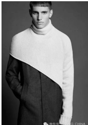
图2 单袖围脖式毛衣内穿外套的新组合形式