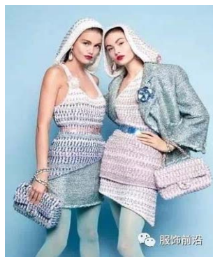
图8 Chanel 广告中的 莫兰迪配色