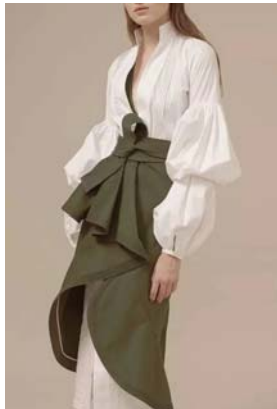
图3 长衬衫外搭配短裙的新组合形式