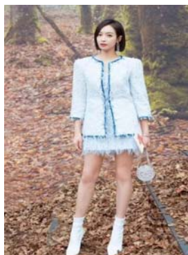
图7 2018 春夏的 Chanel 秀场中的莫兰迪配色