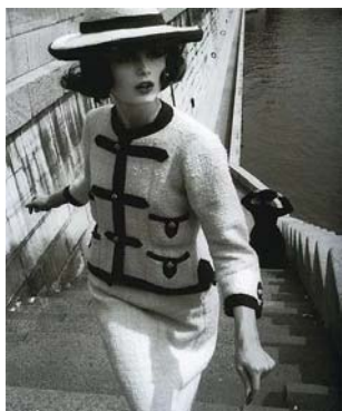
图6 Chanel 套装中的 明度高长调