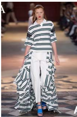
图1 拖地裙摆 Polo 衫搭配裤装的新组合形式

环顾当下的流行时尚，长大衣配阔腿裤造型、连衣裙搭配长裤造型、长衬衣外面套半身短裙等，外套搭配马甲等造型，都是人们对于穿着方式的人类对于服装的组合形式依然在大胆的尝试、变革与创新。