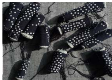
图 9 夸张

在研究中,我们发现南通蓝印花布不仅仅是一块面料,她在文化传统、艺术审美领域所展现的无限魅力,使其成为了当今社会的一个极具地域性的独特文化符号和视觉形象代表,她传达了一个地域的艺术传统和文化内涵,将她和传统刺绣进行结合设计,将会使设计具有更多的可能性。