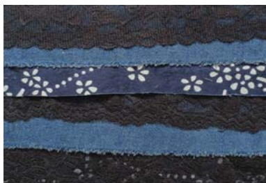
图2 与现代材料组合