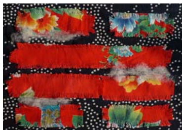
图1 与传统材料组合

蓝与白的纯净组合是蓝印花布给世人的传统色彩印象,在对蓝印花布的色彩创意中,也有使用红与白的色彩组合来进行花布配色的,但在视觉上并没有达到预期的效果。实质上要使传统的蓝印花布在材质的视觉效果上有所不同,棉质的红底大花面料是首选。红底大花面料除具有浓郁的民间喜庆之色外,纹样中的蓝色调也和蓝印花布上的蓝色调相呼应,将这一静一动两种不同色调的民间花布进行组合设计,可以拼也可以贴,这种创新组合的设计方法,充分显示了传统艺术和现代审美观念的有机整合,不仅拓宽了设计的视野,也使传统的蓝印花布给人带来绚丽的效果(图1)。