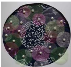
图 8 透叠