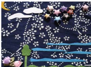
图 7 象形

中国的刺绣历史悠久,距今已有 2000 多年的历史。传统的刺绣是用绣针引各色的彩线,以针线的绣迹将设计好的纹样在纺织品上运针成形。中国历代宫廷绣工的规模就很大,同时民间的刺绣也得到了进一步的发展,除四大名绣之外,还有顾绣、鲁绣、苗绣、京绣、闽绣等等。刺绣发展至今,产生了多变的针法技艺:乱针绣、锁绣、挑花、贴布、满地绣、戳纱、刮绒、错针绣、包梗绣等等,这些流传下来的精美工艺本身就可使刺绣作品呈现出多种传神的造型效果,如果将之和具有显著地域特色的传统手工艺结合设计,又会有怎样的视觉形象?