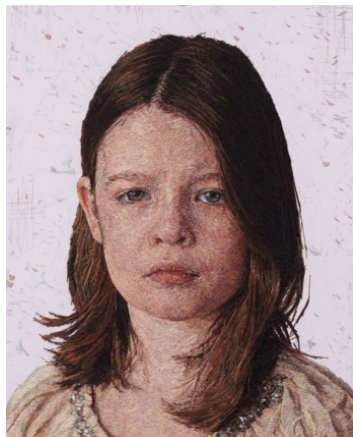
图6 美国艺术家 Cayce Zavaglia 的刺绣肖像作品