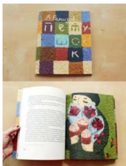
图 3 俄罗斯的 Ann Khokhlova 制作的刺绣书

此外, 俄罗斯一名插画家 Ann Khokhlova 用刺绣作为语言, 制作了一份充满童趣的现代插画刺绣书(图 3)。这本书籍的设计与制作打破了纸质书籍在人们意识中的固有印象。它用颜色艳丽的刺绣色彩, 充满童趣的图案内容, 创作了一本分量感十足的新概念书籍!