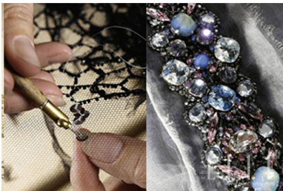
图 1 法国 Lesage 刺绣工坊 [6]

现代手工刺绣的载体已不满足于在各种面料上作绣, 转而采用新的媒介来展现这一精美艺术。它不像传统刺绣那样以生活实用性为前提进行生产和制作, 而是纯粹为了满足个人艺术爱好与审美追求进行的大胆艺术创作。这一点在诸多国外的刺绣艺术品上表现尤为明显。